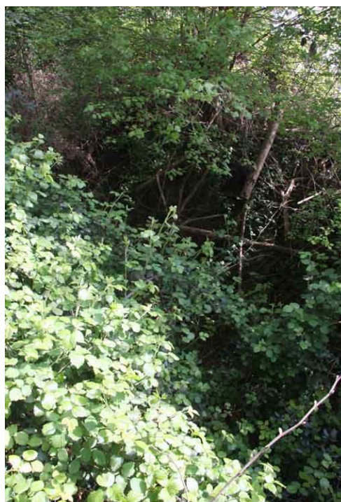
Saut de loup situé vers l'angle du parc au Sud Ouest