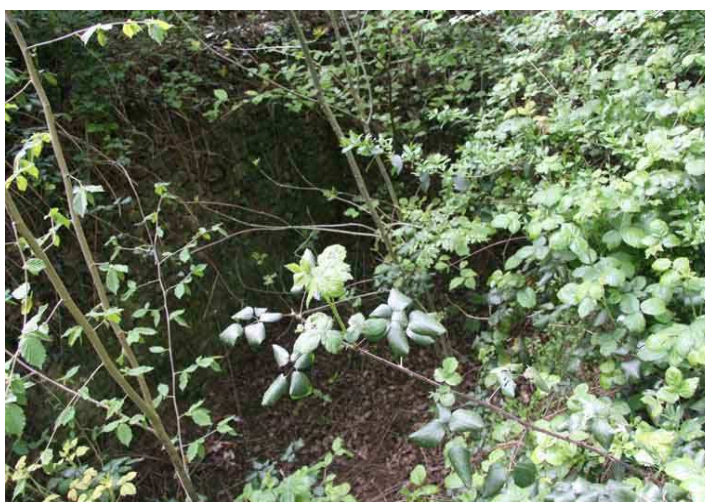
Saut de loup situé vers le centre de la limite Sud du parc