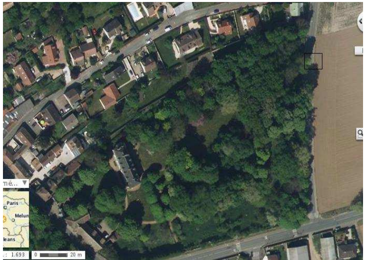
Vue de Géoportail, voir dans le rectangle au N.E.