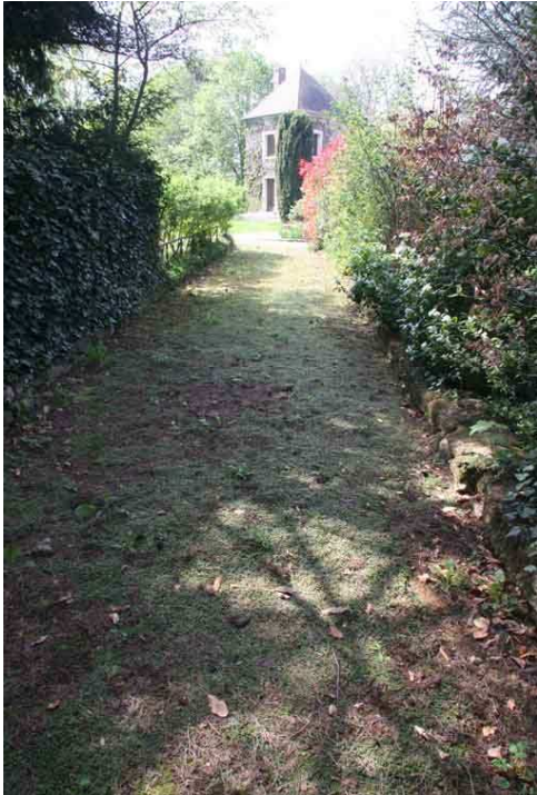
Saut de loup dans la partie arrière

Il est possible qu'il fit partie du château de la Motte détruit il y a plus de 200 ans.