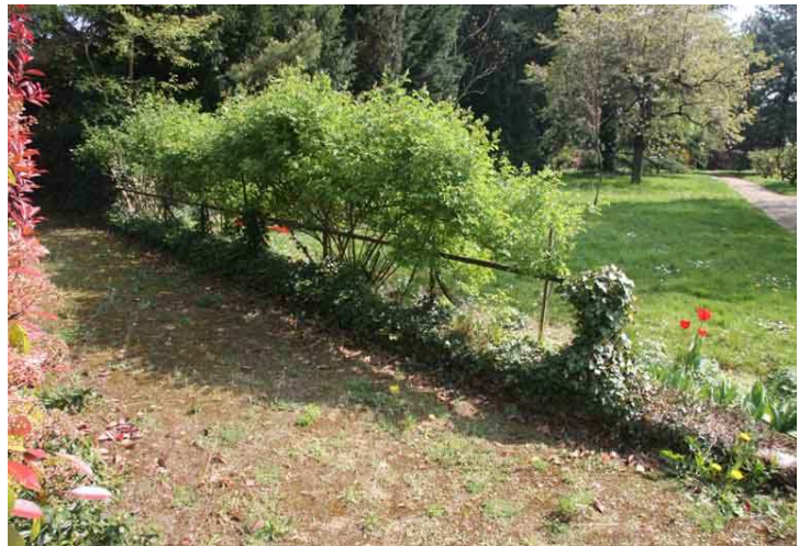
La grille montre que la propriété était à gauche au premier plan