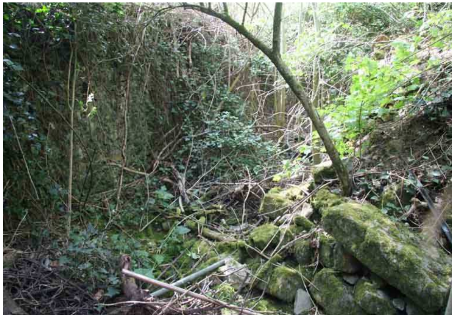
Saut de loup en équerre situé à l'angle Sud Est du parc